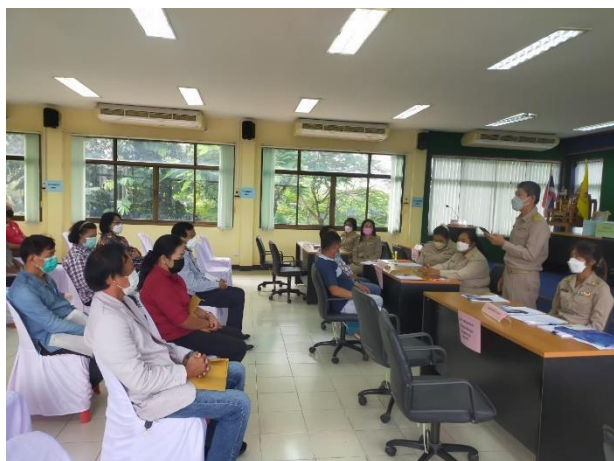
ภาพการดำเนินการ

โครงการจัดการเลือกตั้งนายกองค์การบริหารส่วนตำบลและสมาชิกองค์การบริหารส่วนตำบลโคกไม้ลาย พ.ศ. ๒๕๖๕