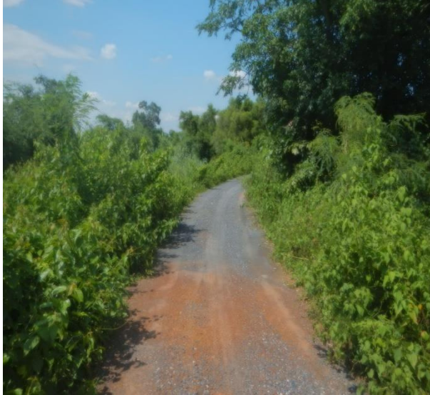
ภาพก่อนดำเนินการ