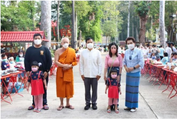
ภาพการดำเนินการ