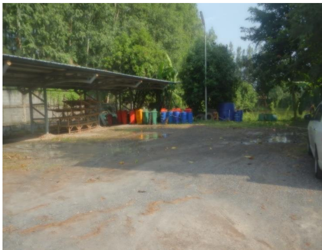
ภาพดำเนินการแล้วเสร็จ