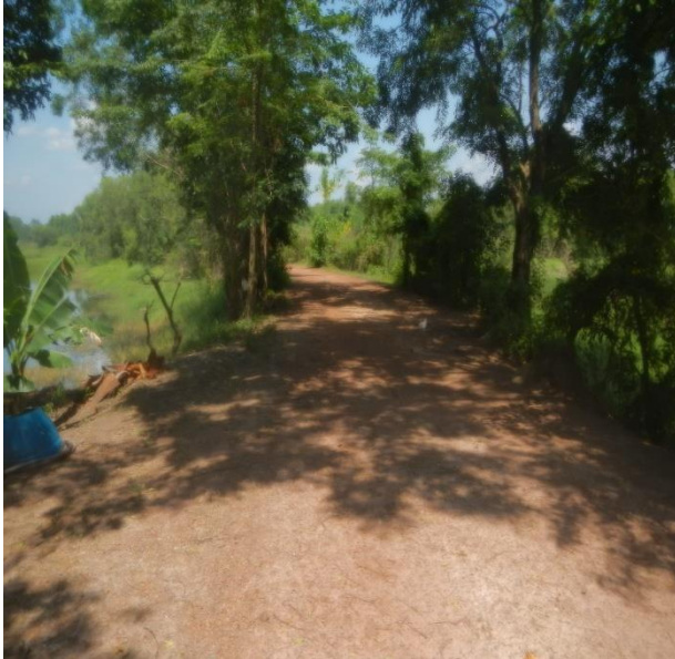
ภาพก่อนดำเนินการ