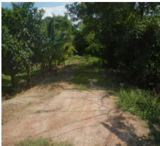
ภาพก่อนดำเนินการ